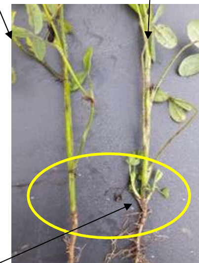
T.Alexandrie TAVOR (mono-coupe) T.Alexandrie POLARIS (multi-coupes)

Semis de l'essai : le 21 août 2018 dans le Loiret (45) Photo réalisée le 22 Novembre 2018