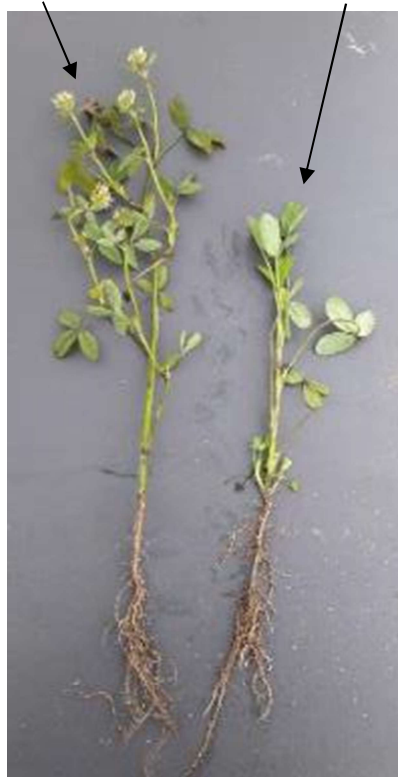
T.Alexandrie TAVOR (mono-coupe) T.Alexandrie POLARIS (multi-coupes)

Intérêts du trèfle d'Alexandrie mono-coupe TAVOR/ECLAIR pour l'association avec les colzas :